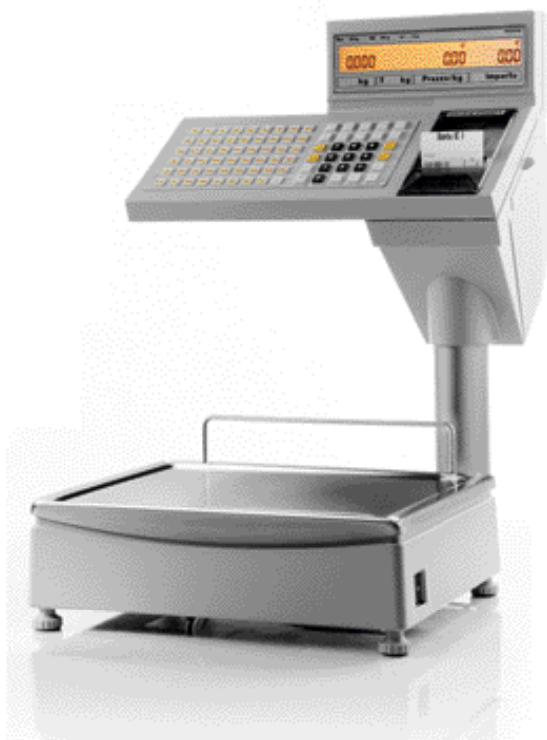
BC II 800 E Bilancia da negozio elettronica con unità display, di servizio e di stampa su supporto

Versatili nell'uso, le bilance BC II offrono tutte le funzioni e le caratteristiche ritenute al giorno d'oggi tipiche di una bilancia Bizerba, sono affidabili, veloci e facili da utilizzare.