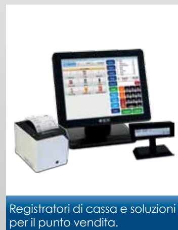
Registratori di cassa e soluzioni per il punto vendita.

HELMAC progetta e produce bilance in regime di qualità metrologica controllata e certificata dal Ministero delle Attività Produttive. Certificato della qualità N. I-006. Organismo Notificato N. 0201.