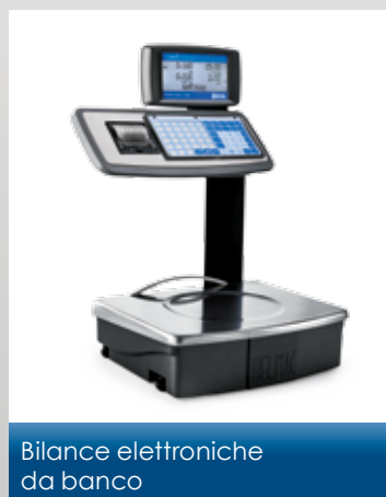
Bilance elettroniche da banco

La gamma dei prodotti di Helmac comprende inoltre: