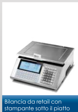
Bilancia da retail con stampante sotto il piatto