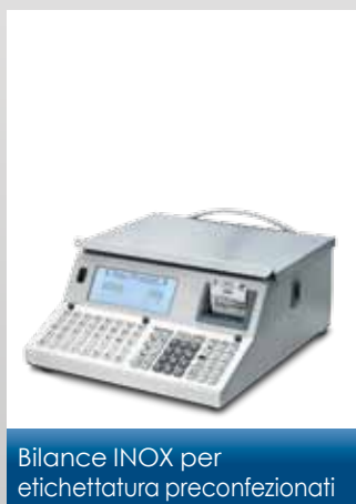
Bilance INOX per etichettatura preconfezionati